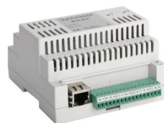
Obr. 2: MWGD 46.IP

Modul funkčně kompatibilní s předchozí verzí, navíc je osazen rozhráním pro přímé připojení na Ethernet pomocí TCP/IP protokolu ( obr. 2 ). Na systémové lince tak může cenově i montážně výhodněji nahradit kombinaci modulu MWGD 46 a převodníku RS 485 / TCP/IP.