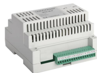
Obr. 1: MWGD 46

Univerzální dvojitý dveřní modul je určený pro připojení čteček s výstupem WIEGAND známých světových výrobců s libovolnou čtecí technologií ( obr. 1 ) a/nebo ovládání bezdrátových zámků APERIO . Lze tak vyhovět požadavkům zákazníků na použití různých identifikačních technologií (HID Proximity, iCLASS, Mifare, Mifare DesFire, Indala apod.) a přitom využít všech předností systému APS mini Plus .